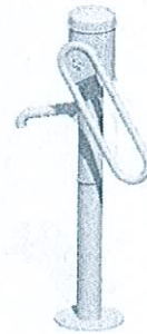
Wasserpumpe mit Schwengel Gesamthöhe 1,17m Edelstahlkonstruktion